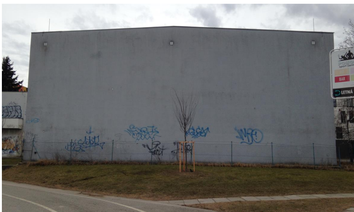
Obrázok 2 - Momentálny stav budovy